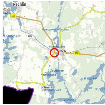
Foto-Vorschau Pegel 58 100.0