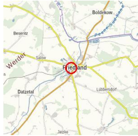
Foto-Vorschau Pegel 04 870.1

Jahresdurchflüsse in Prozent des langjährigen Mittelwertes