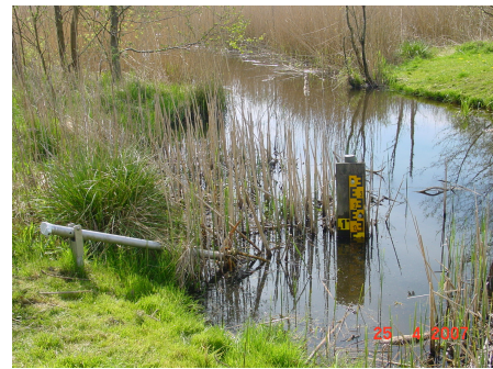
Jahreswasserstände in Prozent des langjährigen Mittelwertes