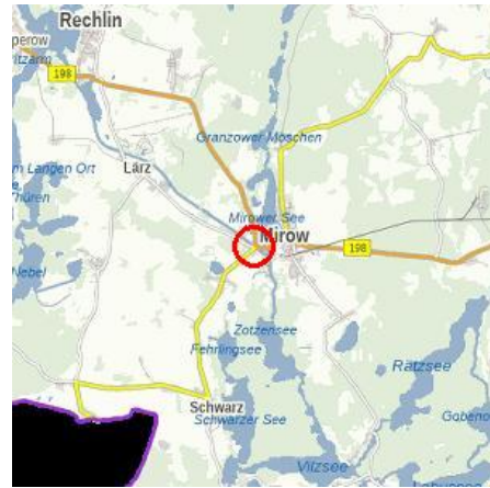
Foto-Vorschau Pegel 58 100.0