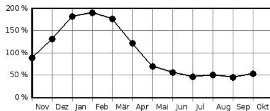
Mittlere monatliche Durchflüsse in % des mittleren Jahresdurchflusses

Pegelausstattung: DFÜ ja LP ja SP nein DS ja DS/DFÜ ja Ultraschall nein