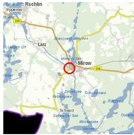
Foto-Vorschau Pegel 58 100.0